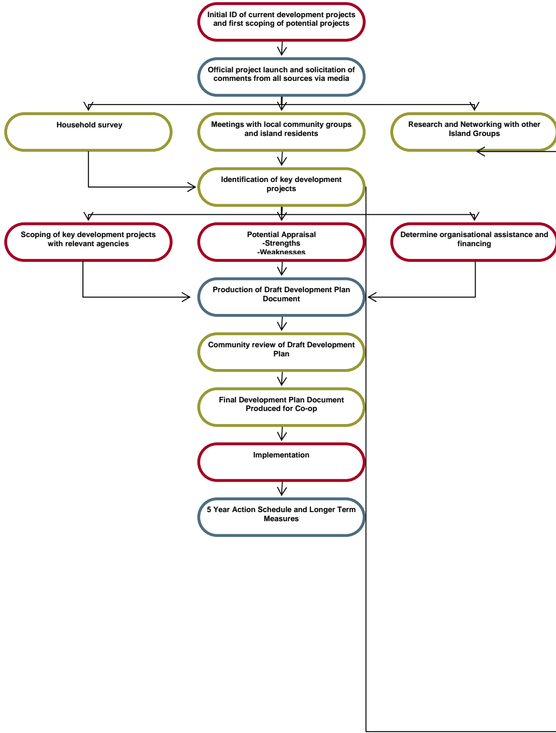
Figúr 1. Próiseas an Phlean